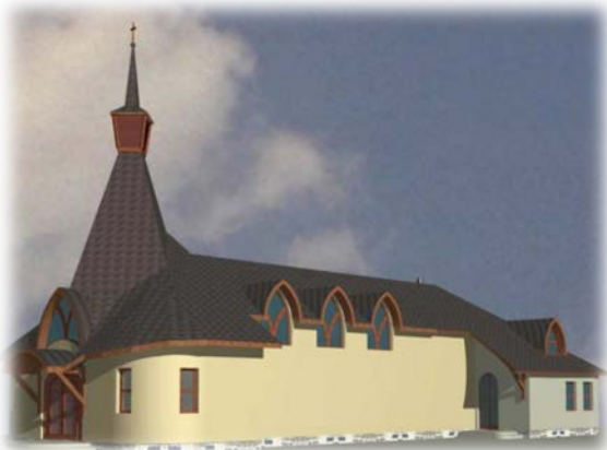
Návrh nové přístavby - pohled zepředu

Investorem dostavby je farnost Velká Polom. Od dubna 2017 se každou 3. nedělí koná sbírka na tento účel ve všech vesnicích farnosti. Chceme také oslovit OÚ v Dolní