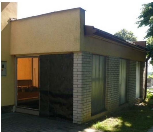
Vchod do skleníku provizorně obitý deskami a lepenkou

Tato část objektu, která se nachází v zadní části kostela, sloužila v minulosti jako chladič box pro zemřelé. Od roku 2002 je tento prostor z větší části nevyužitý, v neděli před mší sv. zde nacvičuje schola a vede zde hlavní vchod do sakristie. Objekt je v havarijním stavu. Již několik let do těchto míst zatéká, vypadly dveře a momentálně je jeden ze vchodů zajištěn deskami a obitý lepenkou.