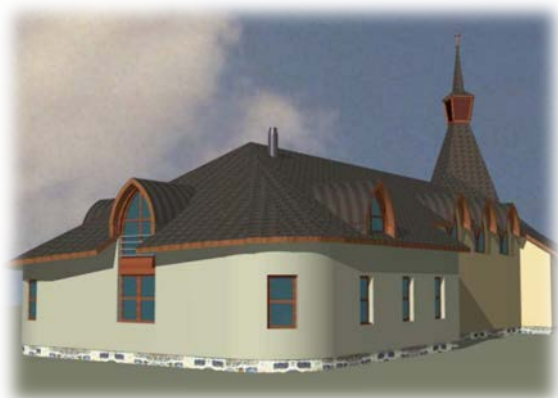
Návrh nové přístavby - pohled zezadu

Lhotě. Dále bychom chtěli požádat farníky o bezúročné půjčky a podnikatele o dary. Podle dostupných finančních možností bychom tuto stavbu rozdělili do několika etap, abychom se nezadlužili na dlouhou dobu. Tímto jsme Vám chtěli přiblížit náš záměr, za který se ve farnosti modlíme a věříme, že s Boží pomocí se toto dílo podaří dokončit.