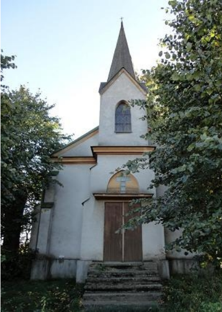
Původní stav – pohled zepředu