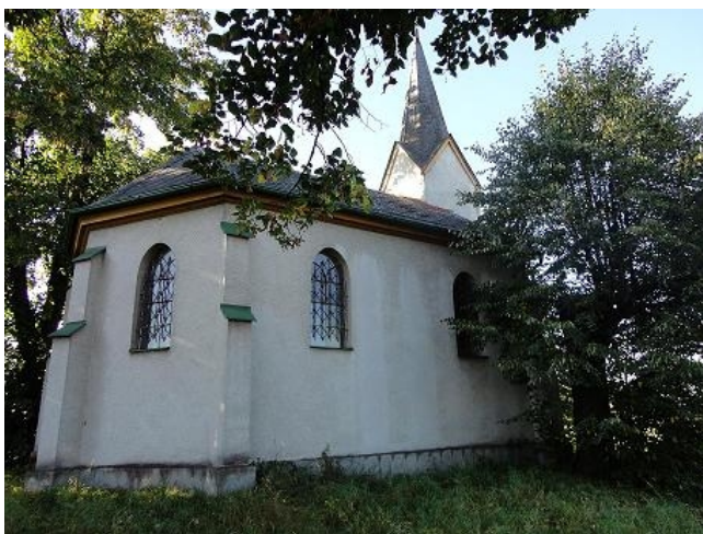
Původní stav – pohled zezadu

V tomto roce se naši Římskokatolické farnosti Velká Polom podařilo získat dotaci 700 000Kč z Ministerstva zemědělství z dotačního programu na opravu kapliček. Také obec Velká Polom nechala provést zpevněnou přístupovou cestu ke kapličce v Hájku, terénní úpravy a přispěla 200 000Kč. Zbytek nákladů na opravu bude z prostředků naší farnosti. Náklady na opravu Kaple a úpravu terénu kolem ní budou dle smlouvy o dílo 995 743. Kč. Zakázku vysoutěžila a zhotovitelem se stala firma Držík s.r.o. z Ostravy Vítkovic. Interiér kaple vybavíme mobiliářem z kaple sv. Andělů strážných z Ostravy Pustkovce, která ji pro naši farnost poskytla dle darovací smlouvy zdarma (za odvoz). Práce by měly být provedeny do konce listopadu tohoto roku. Kaple by měla být znovu posvěcena na jaře příštího roku.