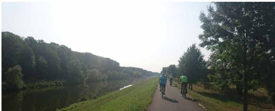
Cyklostezka kolem Baťova kanálu

Po ubytování na místní faře a vydatném obědu, jsme vyrazili na první výlet do nedalekého Holešova, kde jsme shlédli zámecké zahrady zámku Holešov. Den jsme zakončili mši svatou a poté procházkou po městě.