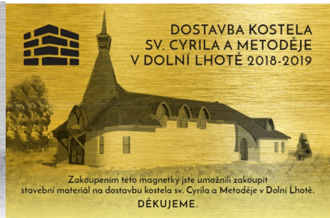
Grafická vizualizace magnetky

Zakoupením této magnetky přispějete na pořízení stavebního materiálu. Magnetky si můžete zakoupit od 17. března po každé mši svaté v sakristii nebo na obecním úřadě u paní Hanky Výtiskové. Magnetky se budou prodávat ve dvojnásobném barevném provedení, stříbrná a zlatá. Stříbrnou obdrží každý, kdo přispěje ve finanční výši 500 - 999 Kč. Zlatou magnetku dostane každý, kdo přispěje finanční částkou 1.000 Kč a více.