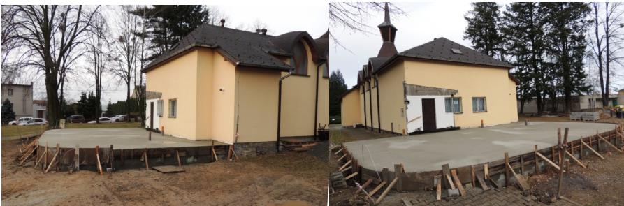
Současný stav - dokončení základové desky

Milí farníci, čtenáři Farního Čtyřlístku, dovolujeme si Vás tímto způsobem informovat o probíhající dostavbě kostela sv. Cyrila a Metoděje. Farníci z Dolní Lhoty se rozhodli zvelebit zadní část našeho kostela tím, že zbourají chátrající a nevyužívanou márnici a přistaví nové prostory pro ucelení celé stavby. Nová budova bude především sloužit jako zázemí pro budoucí kroužky dětí, hudební a pěvecký nácvik pro scholu, výuku náboženství, zázemí pro ministranty atd. Dále se bude využívat pro společensko-kulturní akce, např. rozsvícení adventních svící, dožínkové akce apod. V neposlední řadě bude sloužit jako zázemí pro různé obřady, a to jak křtiny, svatby, tak i smuteční obřady.