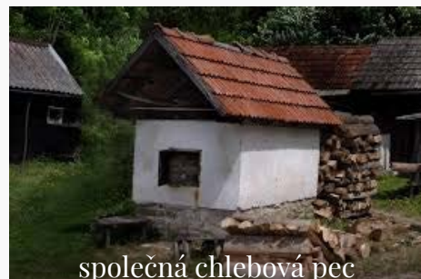
společná chlebová pec